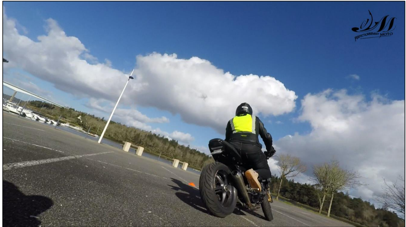
Exercices de maniabilité sur parking fermé à la circulation